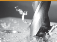
FRESAS DE PERFORACIÓN